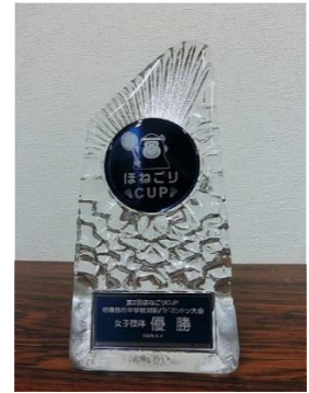
【↑バドミントン団体優勝トロフィー】